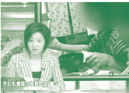
子ども食堂の役割とは

「ゆがふう子ども食堂」が2016年6月4日(土)の「報道特集」で放映されました。